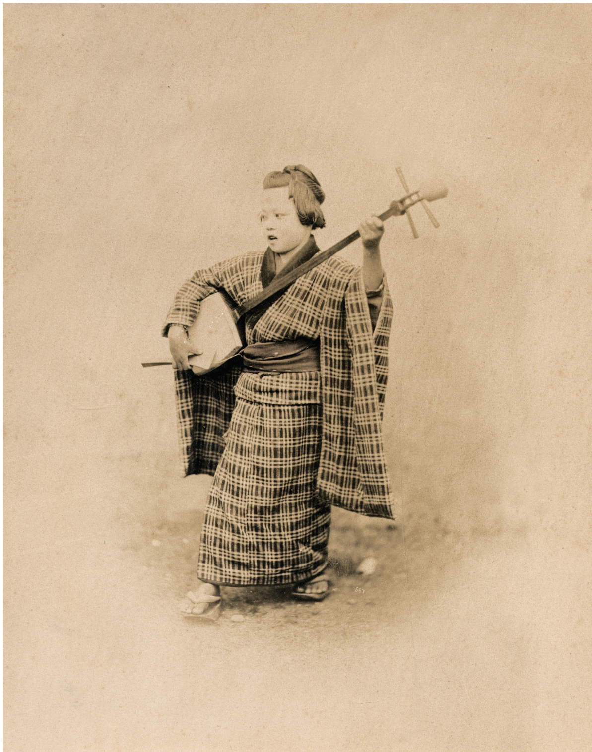
Felice Beato, Suonatrice di Shamisen Fotografia all'albumina, 1865 ca.