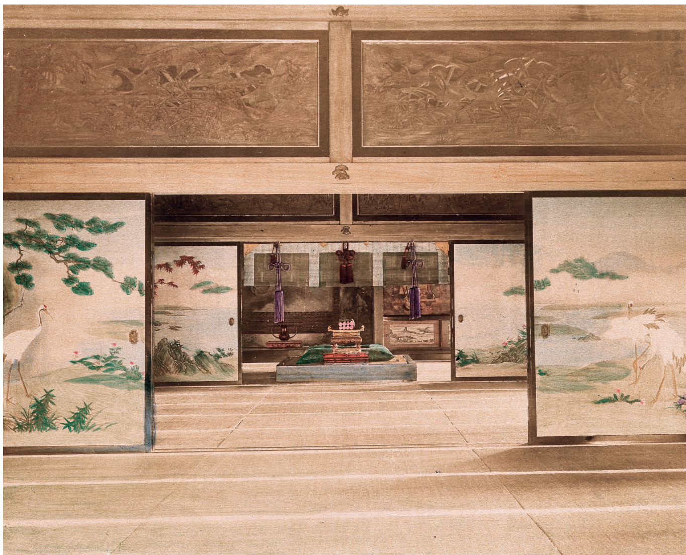
Tamamura Kozaburo, Interno di palazzo nobiliare Fotografia all'albumina colorata a mano, 1880 ca.