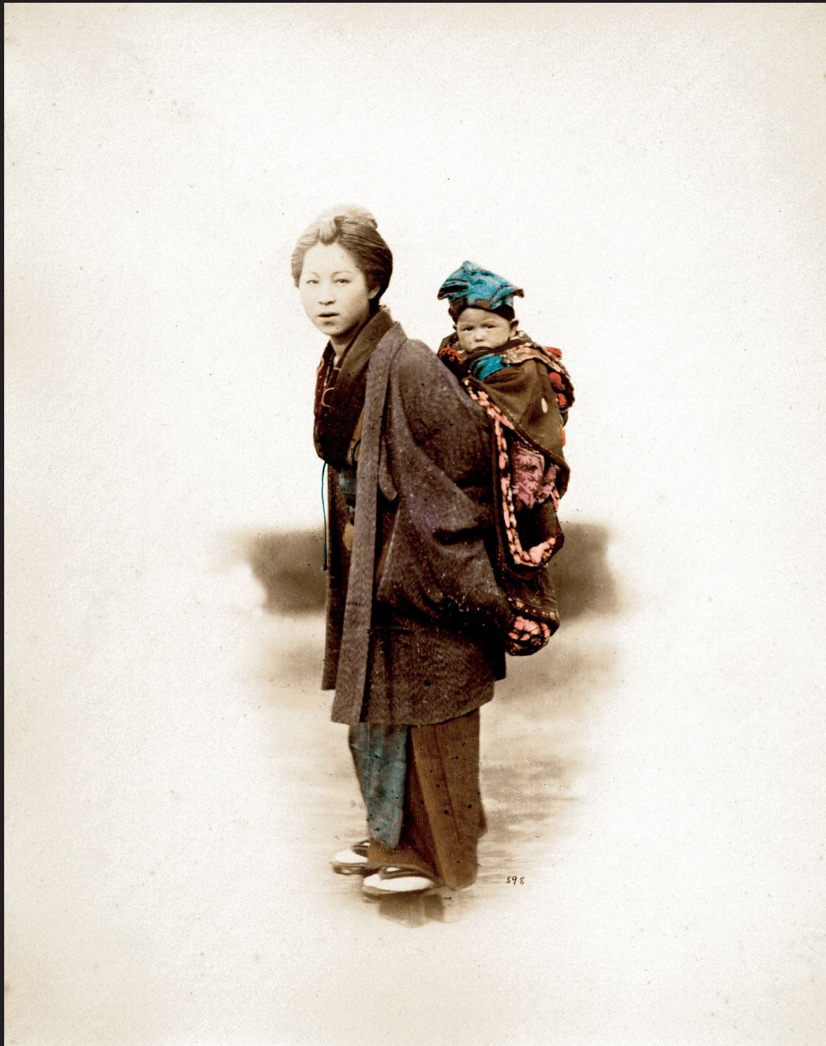
Felice Beato, Madre con bambino Fotografia all'albumina colorata a mano, 1870 ca.