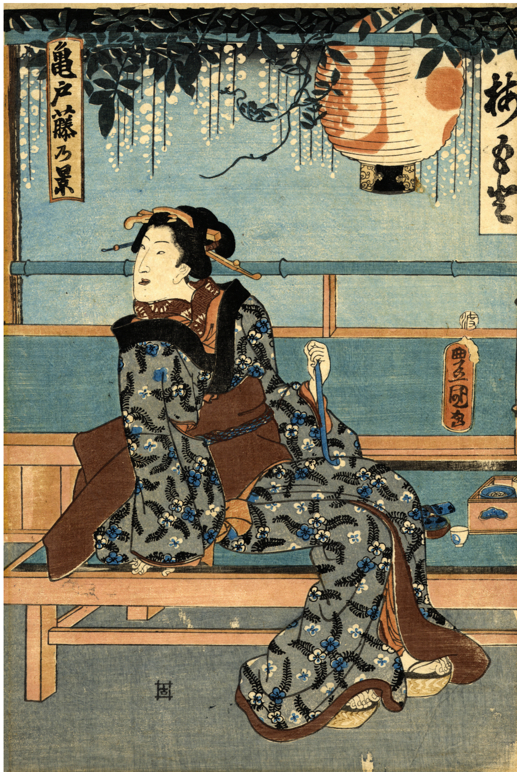
Utagawa Kunisada (Toyokuni III), Bijin che fuma la pipa in un interno Xilografia policroma, 1846 ca.