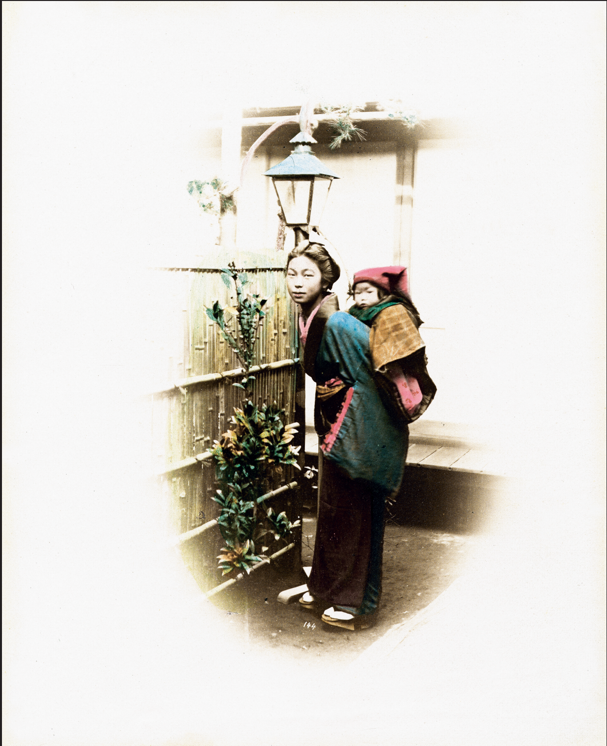
Felice Beato, Madre con bambino Fotografia all'albumina colorata a mano, 1870 ca.