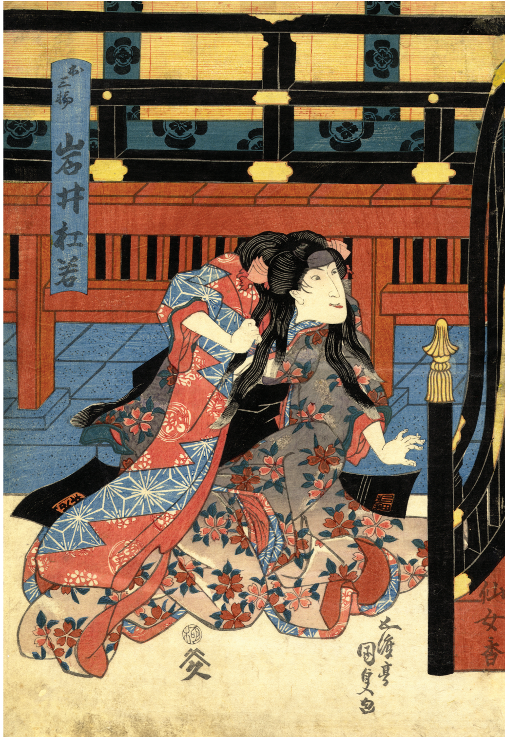
Gototei Kunisada (Toyokuni III), Lattore Iwai Tojaku Xilografia policroma, 1830 ca.