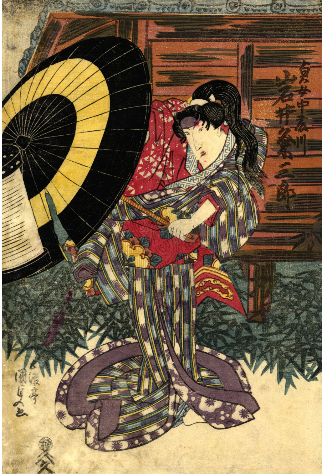
Gototei Kunisada (Toyokuni III), Bijin Xilografia policroma, 1820 ca.