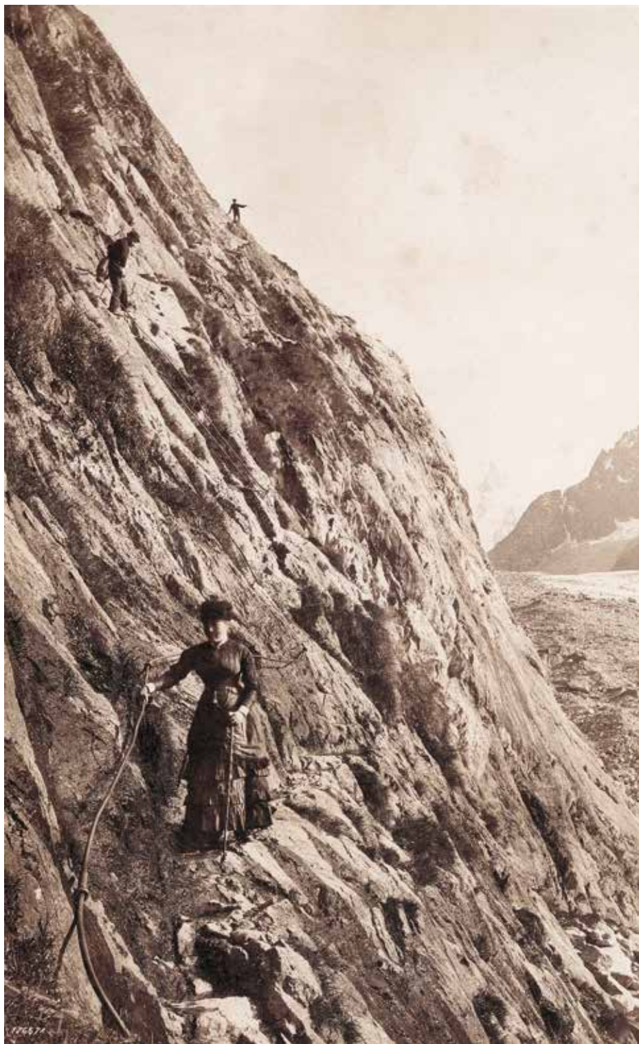
Francis Frith Passeggiata alpina Fotografia all'albumina, 1870 ca.